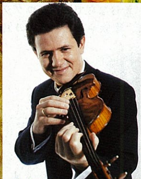
〈指揮・ヴァイオリン〉 アントン・ソロコフ