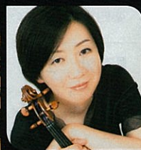
甲斐 史子 (ヴァイオリン)