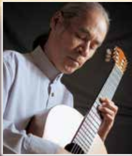
荘村清志 (ギター) ©得能通弘 CHROME