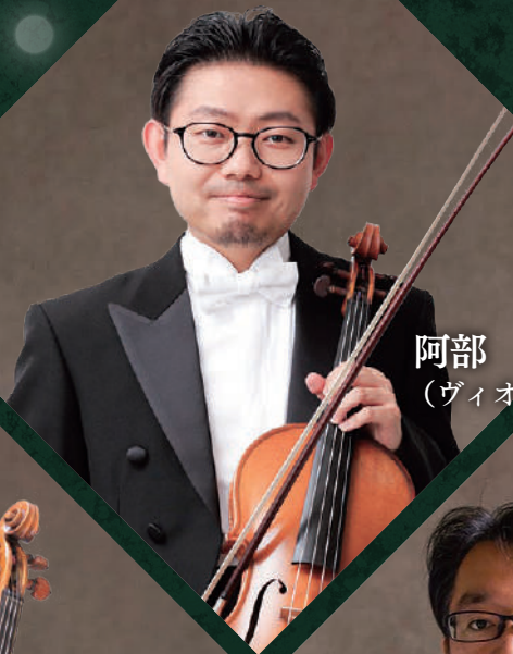
阿部 哲 (ヴァイオリン)