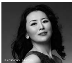
カルメン Yayoi Toriki 鳥木弥生

東京藝術大学卒。第51回バザン国際指揮者コンクール優勝を経て、日本国内および欧州各地で活躍。スイス・ロマン管首席客演指揮者、モンテカルロ・フィル首席客演指揮者、日本フィル正指揮者、仙台フィルミュージック・パートナー、オーケストラ・アンサンブル金沢ミュージック・パートナー、横浜シムフォニエッタ音楽監督、東京混声合唱団音楽監督。