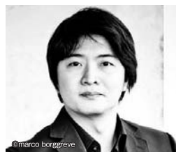
指揮 Kazuki Yamada 山田和樹

【あらすじ】1820年代スペイン南部の都市セビリア。タバコ工場で働くカルメンは自由奔放な性格と妖艶さから街の男たちの憧れの的だ。ある日、同僚女工たちと騒動を起こして捕まったカルメンだが、牢屋への護送を命じられた竜騎兵ドン・ホセをその魅力で巧みに誘惑し、酒場で落ち合う約束をして縄を解かせる。その後逃亡したカルメンと酒場で再会したドン・ホセは、またもやたぶらかされて軍を脱走し、彼女の仲間たちとともに密輸に手を染める。道中、仲間たちはカードで行く末を占うが、カルメンだけが何度占っても不吉な結果に……。そして、見張り役のドン・ホセの前にカルメンを探しにきた人気闘牛士エスカミーリオが現れ、二人は決闘騒ぎとなる。彼もまたカルメンに誘惑されていたのだ。騒ぎが収まるとドン・ホセの婚約者ミカエラが現れる。彼女の説得にも聞く耳持たないドン・ホセだったが、母の危篤を告げられると未練を残しつつ母の元へ戻る。その後エスカミーリオとカルメンは恋仲となり闘牛場にいる。そこに嫉妬に狂うドン・ホセが現れ復讐を迫るがカルメンは拒否、逆上したドン・ホセの凶刃に倒れる。