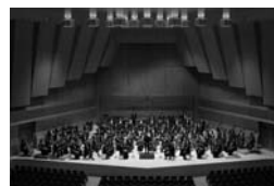
管弦楽 仙台フィルハーモニー管弦楽団

横手市出身。国立音楽大学声楽科卒業、同大学院声楽専攻オペラコース修了。二期会オペラ研究所第50期修了。修了時に優秀賞・奨励賞受賞。新国立劇場オペラ研究所第10期生修了。平成27年五島記念文化賞オペラ部門受賞。長谷川留美子、田口興輔、セルジオ・ベルツキ、パオラ・モリナーリの各氏に師事。