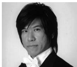
エスカミーリオ Shingo Sudo 須藤慎吾

国立音楽大学卒業。第13回フランチェスコ・パネーゼ国際声楽コンクールをはじめ、第9回マダム・バタフライ世界コンクールでグランプリ、第40回日伊声楽コンクール第1位等、他受賞多数。イタリアオペラを中心に40以上の幅広いレパートリーを有し、日本を代表するアリモ・テノールとして国際的に活躍している。藤原歌劇団員。