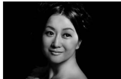
こうだ ひろこ 幸田浩子 [ソプラノ]

東京藝術大学首席卒業。同大学院、文化庁オペラ研修所を経て、ボローニャ、ウィーンにて研鑽を積む。数々の国際コンクールに上位入賞後、欧州の名門劇場へ次々とデビュー。ローマ歌劇場、ベッリーニ大劇場、シュトゥットガルト州立劇場等で主要な役を演じて活躍後、ウィーン・フォルクスオーパーと専属契約。専属を離れてからも『魔笛』夜の女王などで客演。国内では新国立劇場、二期会などの舞台で主役級を演じる他、全国各地でのリサイタル、更にはNHK-FM「気ままにクラシック」で笑福亭笑瓶氏と4年間パーソナリティを務めるなど多彩な活動を展開。2012年よりBSフジにて音楽&トーク番組「レシビ・アン」(毎週土曜午後6時30分)にMCとしてレギュラー出演中。CDは《ふるさと〜日本のうた》をはじめ6枚のソロアルバムをリリース。第14回五島記念文化賞オペラ新人賞、第20回エクソソモービル音楽賞洋楽部門奨励賞受賞。二期会会員。 http://columbia.jp/koudahiro/