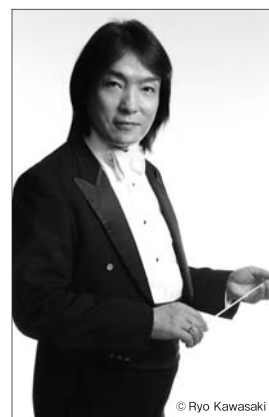
オフィシャル・ホームページ www.iimori-norichika.com

貧しい箒作りの職人の夫婦ペーターとゲルトルトの子供、ヘンゼルとグレーテルの兄妹は、ある日母の言いつけで、森へ野苺を摘みに出掛ける。山の奥深くに入り過ぎてしまい道に迷ってしまう。夜になり歩き疲れた2人は眠りに落ちて、14人の天使が現れる夢を見る。翌朝、森をさまよい歩いてお菓子の家を見つけた。空腹の2人がたまたま家を食べていると、魔女が現れつかまつってしまう。そこは子供を食べてしまう恐ろしい魔女の家だったのだ。魔女はヘンゼルを檻に閉じ込め、グレーテルには身の回りの世話をする。しかしグレーテルは機転を利かせ、魔女を籠に押し込んで難を逃れた。すると魔法で姿をお菓子にかえられていた子供たちがもとの姿に戻ったのだった。二人を探しにやってきた両親、子供たちは再会を喜び、神に感謝を捧げる歌を歌う。