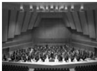
管弦楽 仙台フィルハーモニー 管弦楽団

横浜生まれ。テレビ朝日アナウンサー時代は「ニュースステーション」やスポーツ実況で活躍。フリーになってからはTV・ラジオ・CMのほかクラシック・オペラコンサートの司会や企画にも独自のフィールドを広げている。