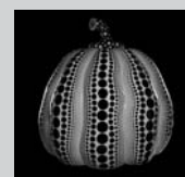
大なる巨大な南瓜 2011年

©YAYOI KUSAMA, Courtesy of Victoria Miro Gallery, OTA FINE ARTS.