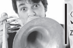
〈トロンボーン〉 ゾルタン・キス Zoltan Kiss Trombone