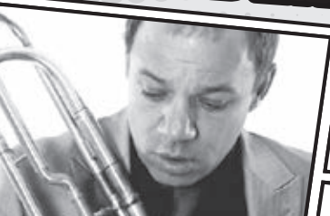
〈トロンボーン〉 ゲアハルト・ フュッスル Gerhard Füßl Trombone