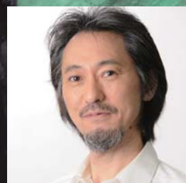
シュバウン(シューベルトの親友) 近藤真行 (劇団「わらび座」座友) 三種町出身 脚本・演出: ひのまどか (音楽作家)